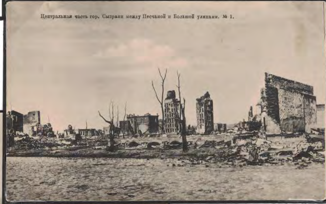
Центральная часть гор, Сызрани между Песчаной и Большой улицами. № 1.

В истории Сызрани 05.07.1906 г. произошел страшный пожар. Огонь бушевал сутки и уничтожил 5500 домов. Погибло не менее 1000 человек, без крова осталось более 30 000 жителей.