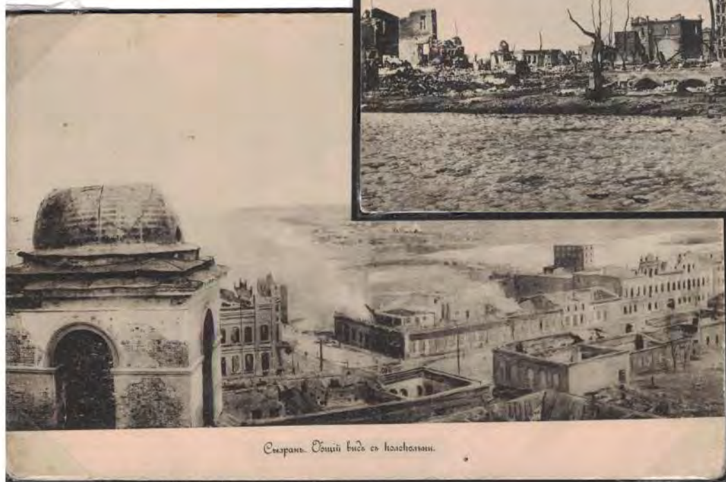
Сызрань. Вид с холма.

Общие убытки в ценах того времени составили примерно 18 млн. руб.